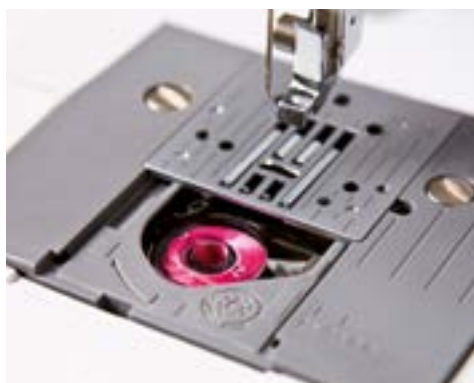
Snel verwisselbare spoel